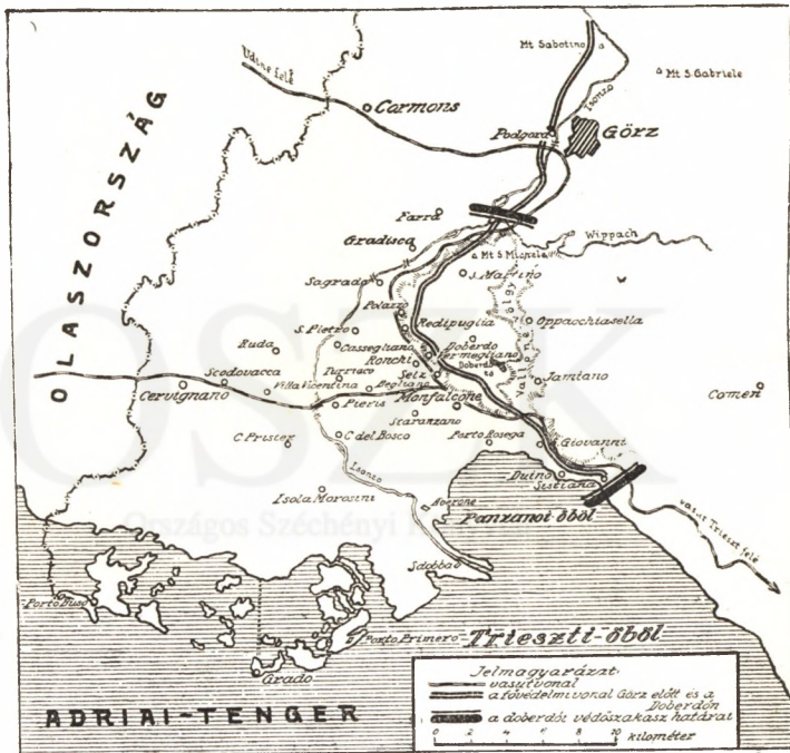
1. sz. vázlat.