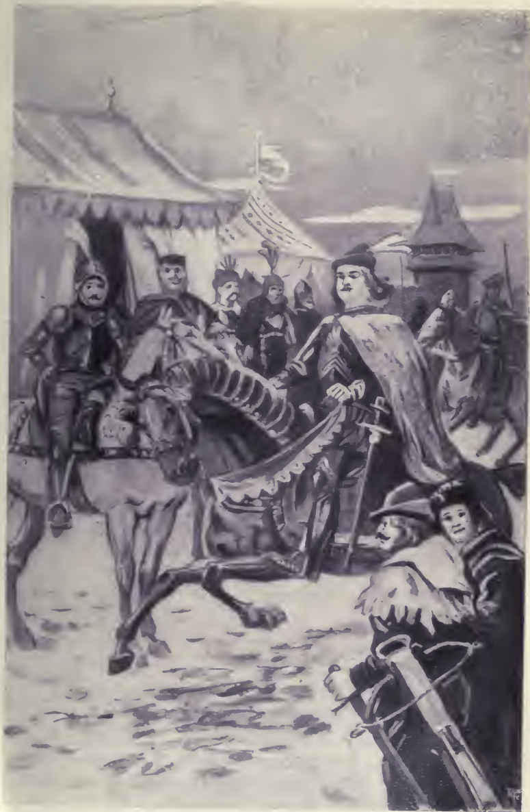
Az ifjú harcász, barna paripán ült.