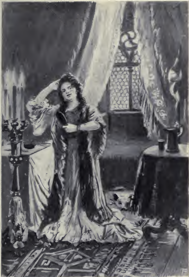
Az asztalok megrakva mindennel . . .