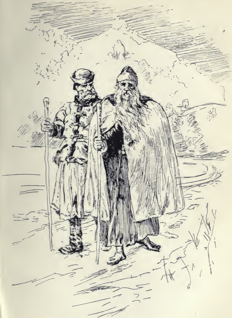
Két öreg haladott csendesen Buda felé.