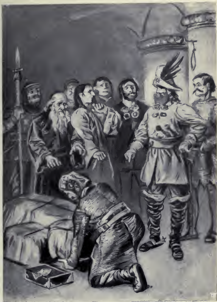
Az agg izraelita mint a nyárlevél reszketett.