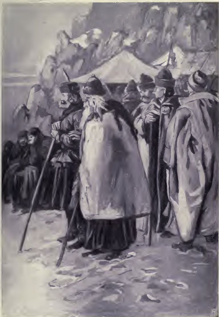
Az öregebb a szolga vállára támaszkodott.