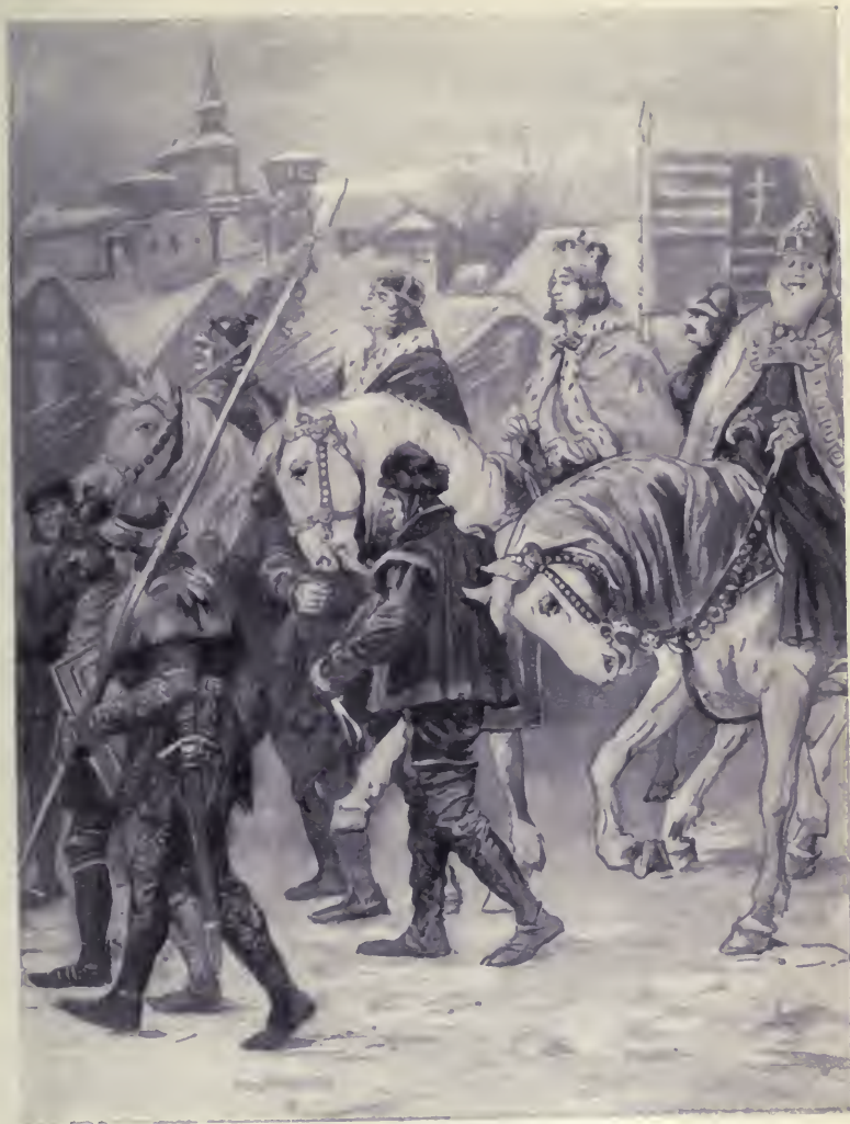
Az ifjú király érkezett.