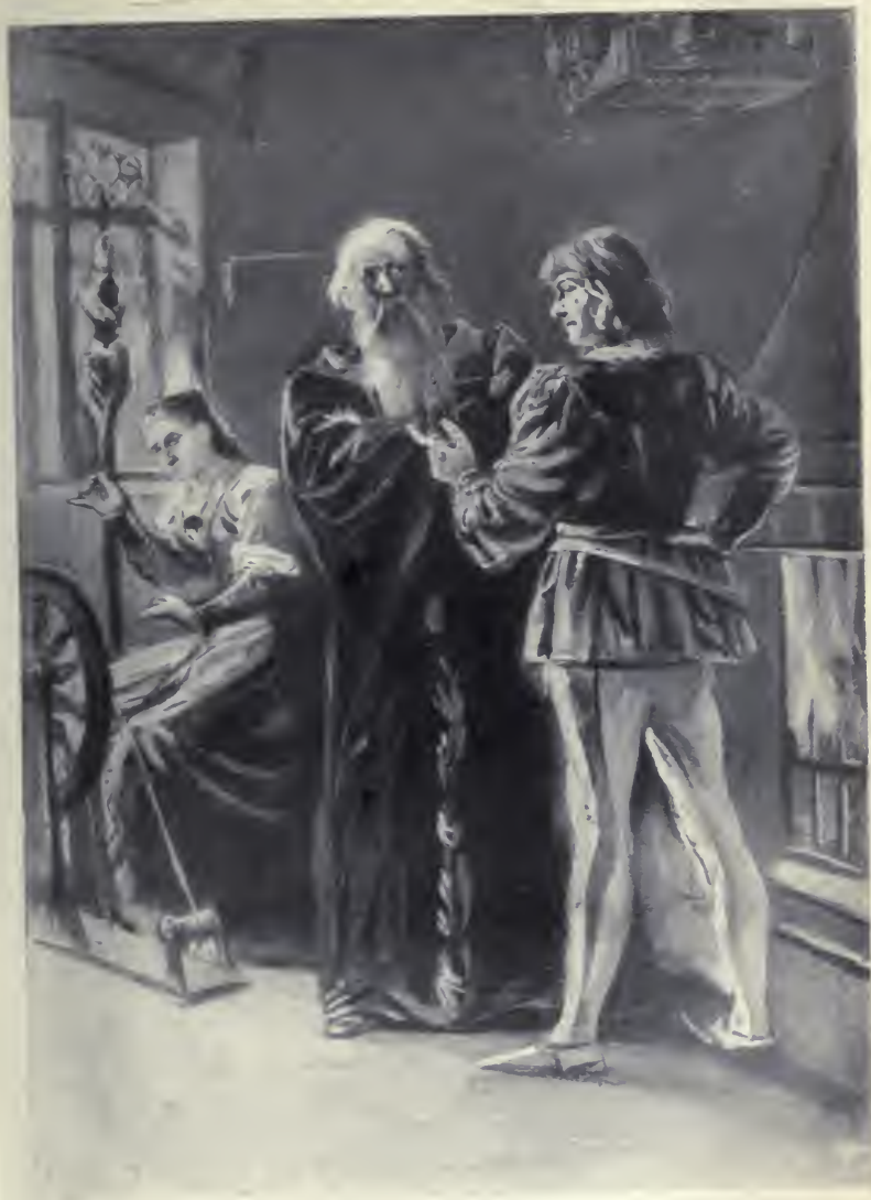
A kis Izabella vörös pamutot font.