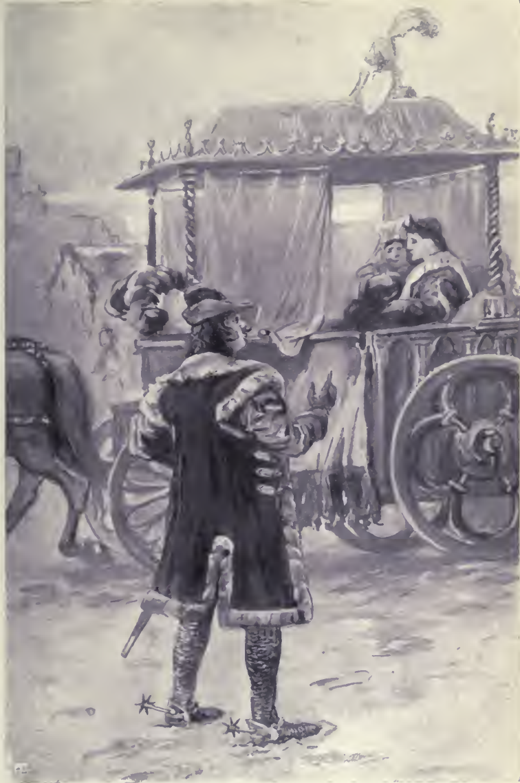
Szemei a hintóra voltak szegezve.