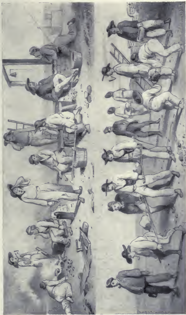
Bottal és bot nélkül.